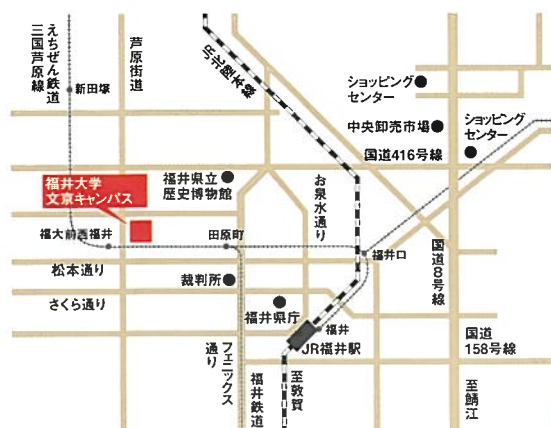
文京キャンパス内マップ

〒910-8507 福井市文京3-9-1 TEL/FAX:(0776) 27-9858 E-mail: danjyo@ml.cii.u-fukui.ac.jp