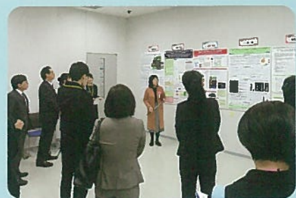
2016年12月3日 合同研究発表会の様子