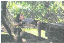
Seven Sacks of Rice

10:50 七つの米袋 103分 監督: マリセル・カリアガ 【フィリピン】 2016年 ドラマ