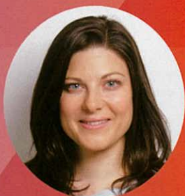
ヨハンナ・ウッカマン氏 独・社会民主党常任理事 元党青年局全国代表