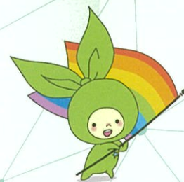
埼玉大学マスコットキャラクター メリンちゃん

文部科学省科学技術人材育成費補助事業 「ダイバーシティ研究環境実現イニシアティブ(特色型)」